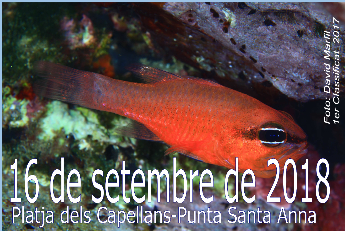
1er Classificat. 2017